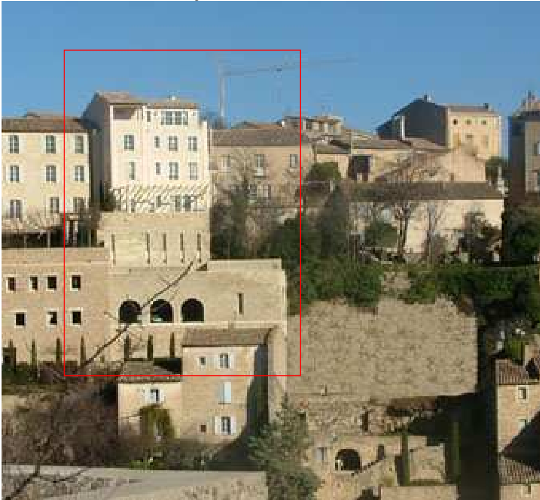
La façade arrière de l'extension