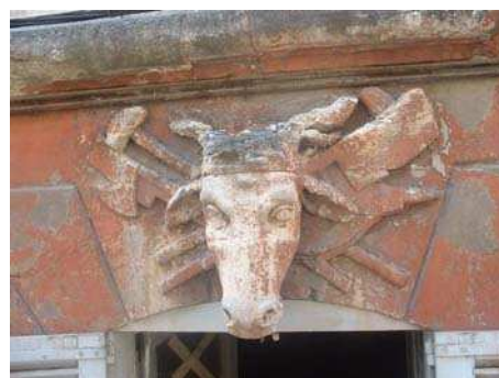
Tête de bœuf en clef de voûte