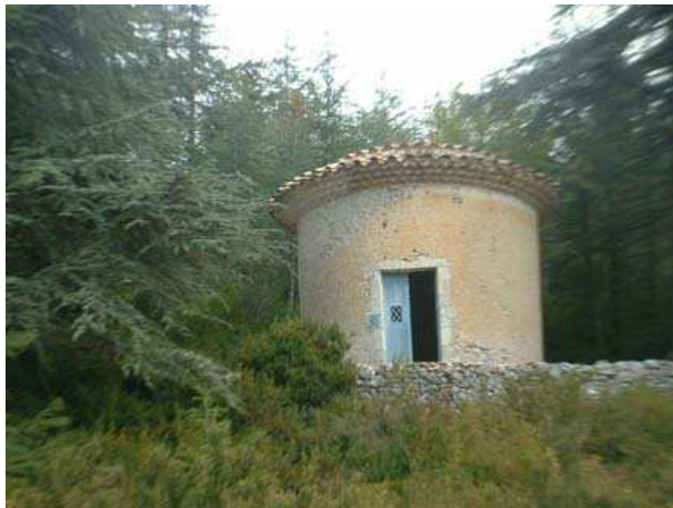
vue de l'ouest

Corniche circulaire en plâtre et riche décor en trompe-l'œil : pilastres à chapiteaux et panneaux en faux marbre, voûte céleste étoilée sous la coupole. Autel en faux marbre. Sol en tomettes de terre cuite.